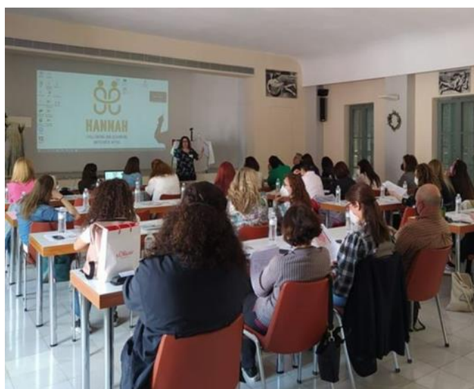
Слика: учесници током семинара у мају 2022. који је организовао Јеврејски музеј Грчке

Сваки партнер пројекта Хана организује четири семинара у својој земљи како би унапредили знање о локалној јеврејској историји и Холокаусту, и како би се повећала свест о антисемитизму, развила иновативна средства против антисемитизма и допринела борби против њега кроз изградњу капацитета подизања свести и