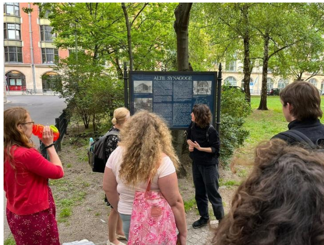
Слика: учесници током семинара у Берлину у мају 2022. ког је организовала Центропа

Више о прошлим Хана семинарима можете прочитати овде .