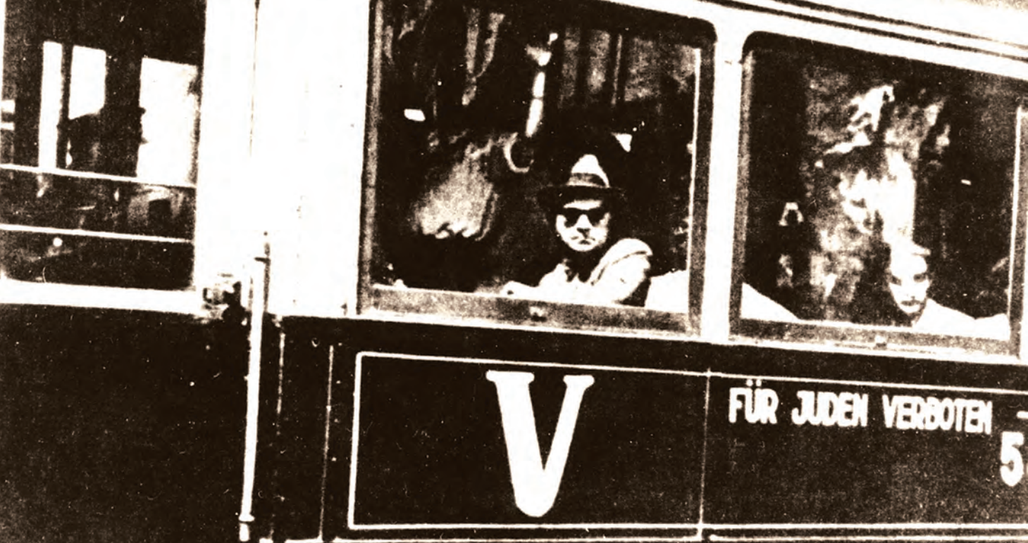
Трамвај у Београду за време окупације са знаком "V" и натписом "Забрањено за Јевреје"