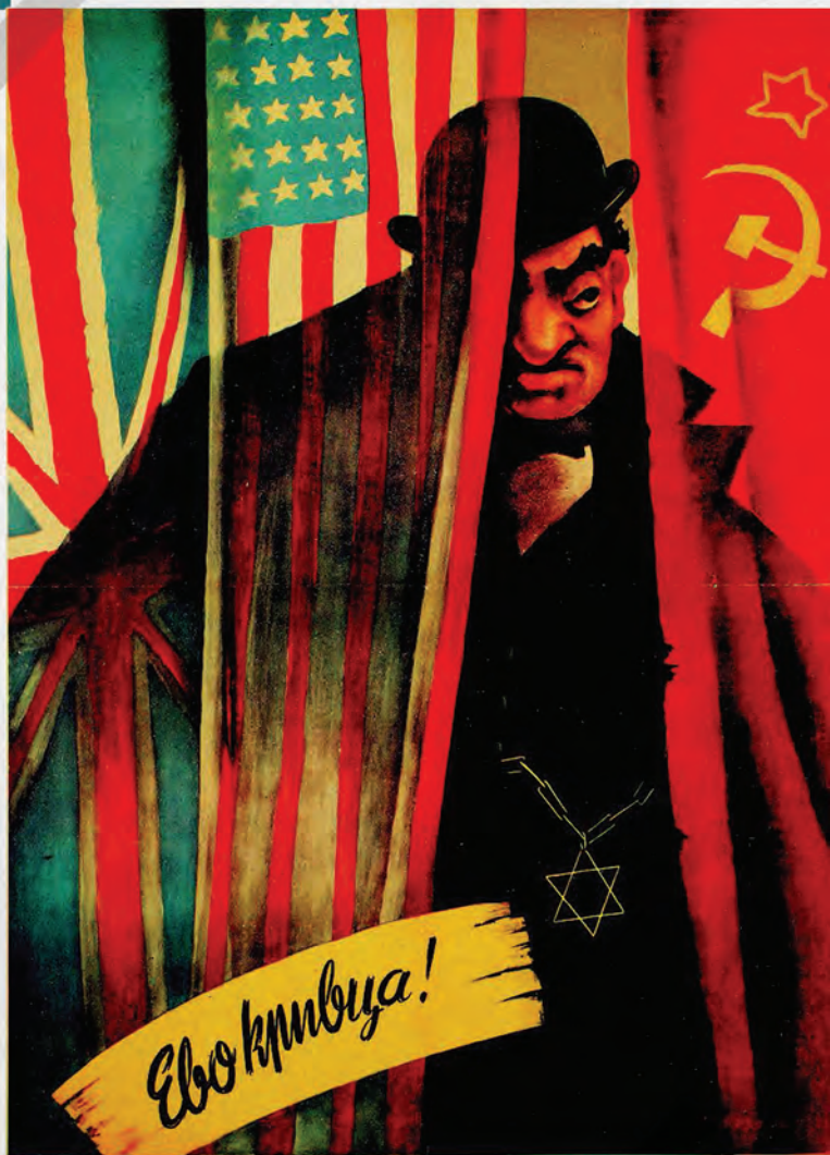
Антијеврејски плакат изложен на Антимасонској изложби у окупираном Београду у октобру 1941.

Након што је у мају 1942. приказана у Загребу, усташка антијеврејска изложба под називом „Жидови - изложба о развоју жидовства и њиховог рушилачког рада у Хрватској прије 10. травња 1947. године. Рјешење жидовског питања у НДХ“, отворена је 19. августа у окупираном Земуну. Осим антисемитских оптужби преузетих из нацистичког расистичког наратива, усташка пропаганда је истовремено и антијугословенска и антисрпска, а Јевреји се између осталог оптужују и да су створили „државно чудовиште Југославију“.